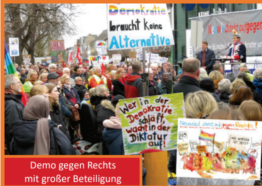
Demo gegen Rechts mit großer Beteiligung