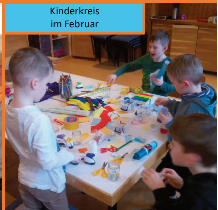
Kinderkreis im Februar