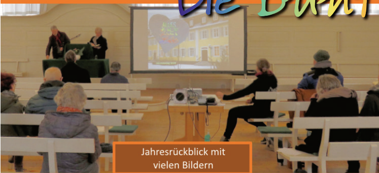
Jahresrückblick mit vielen Bildern