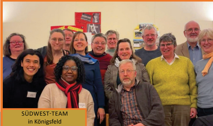
SÜDWEST-TEAM in Königfeld