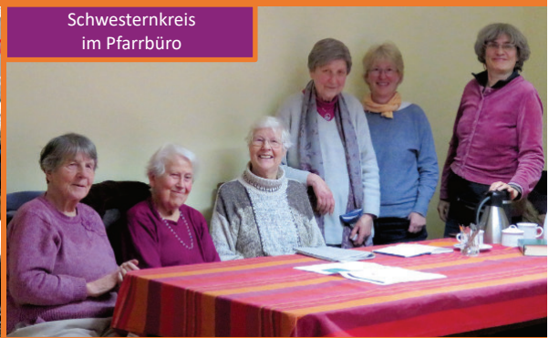
Schwesternkreis im Pfarrbüro