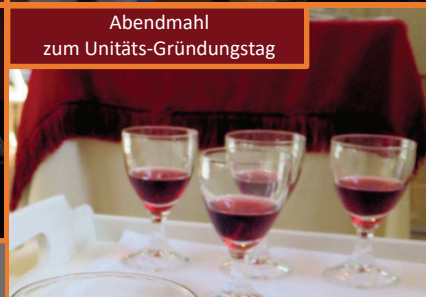
Abendmahl zum Unitäts-Gründungstag