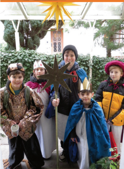
Sternsinger des Sonnenlandviertels