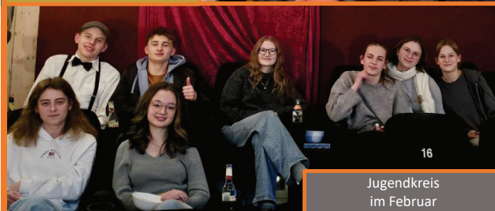
Jugendkreis im Februar