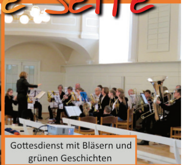
Gottesdienst mit Bläsern und grünen Geschichten