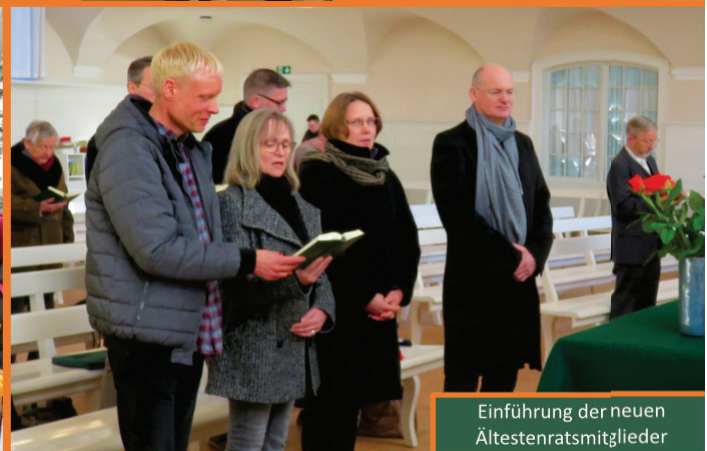
Einführung der neuen Ältestenratsmitglieder