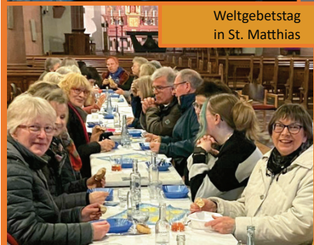
Weltgebetstag in St. Matthias